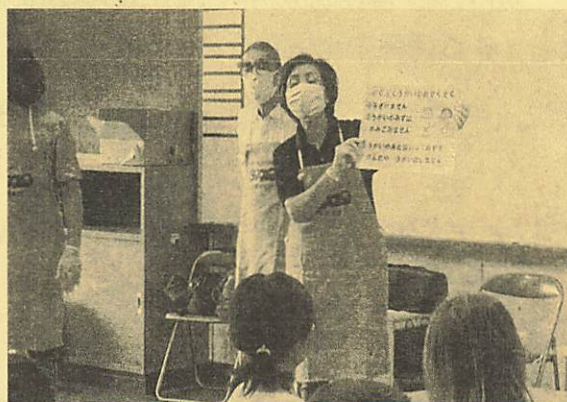
うがい時のお約束を読み上げて、子どもたちのぶくぶくうがいをサポートします。